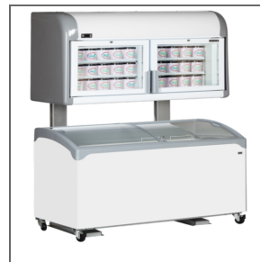
Vhodné spolu s mrazničkou umístěnou dole