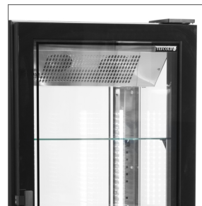
Dveře bez rámu