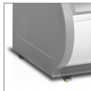
Kolečka s brzdou i bez brzdy