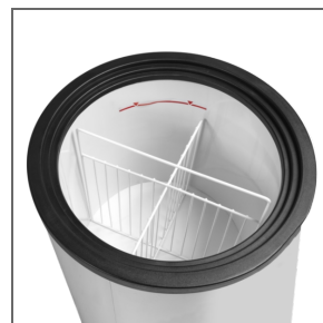
Systém dělicích přepážek