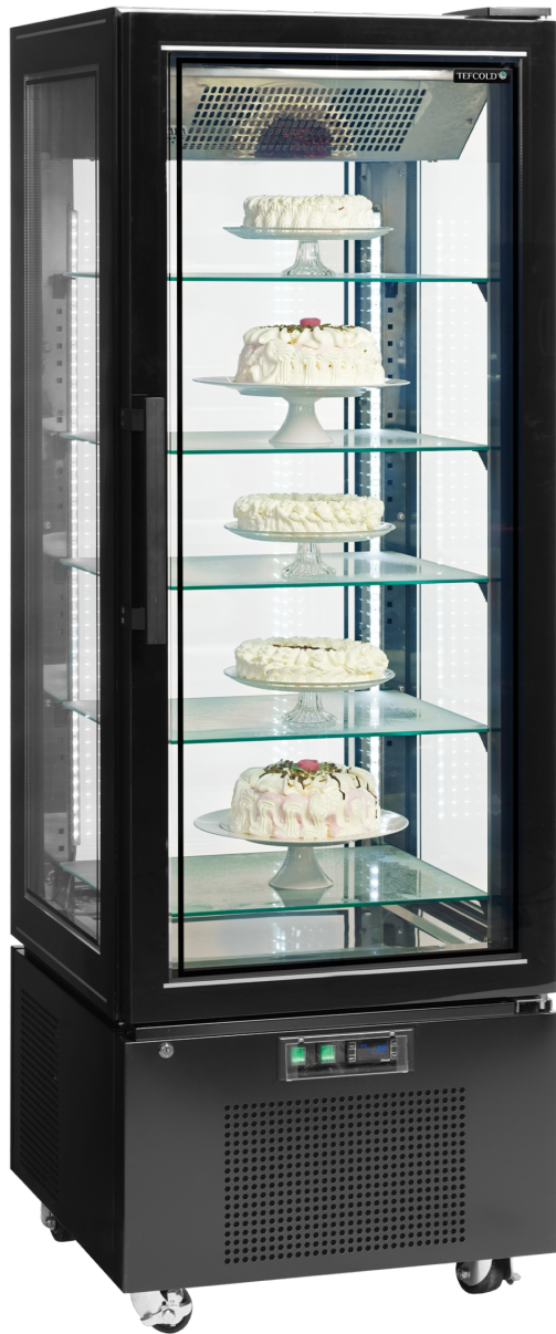
UPD 400 F Black Mrazicí vitrína panoramatická