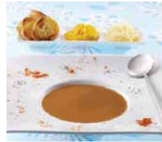
RYBÍ POLÉVKY, KORÝŠI