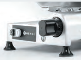
Tloušťka plátku nastavitelná v rozmezí od 0 mm do 16 mm pomocí voliče