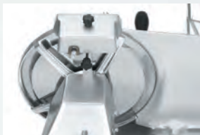
Ochrana ostří v podobě trvale namontovaného kroužku