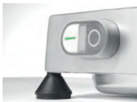
Uzavřený bezpečnostní vypínač