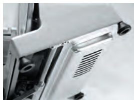
Vzduchem chlazený motor chráněný kovovým krytem