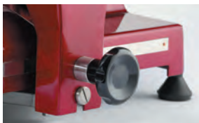
Uzavřený bezpečnostní vypínač