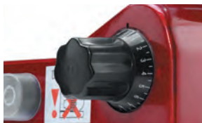
Tloušťka řezu je snadno nastavitelná