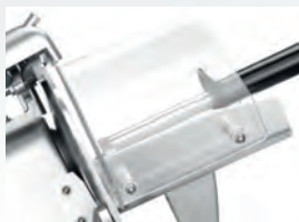
Ochranný akrylový kryt