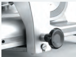
S uzamykatelným mechanismem