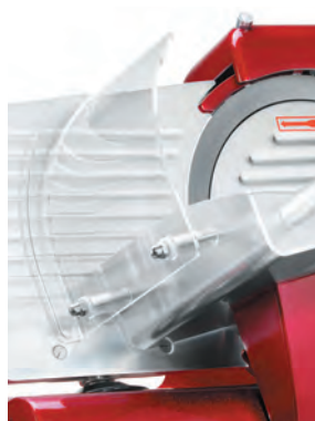
Ochranný akrylový kryt