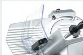
Ochranný akrylový kryt

Snadná hygiena – jednoduchá demontáž všech součástí