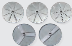
Včetně 5 disků, 2 na krájení 3 na struhání