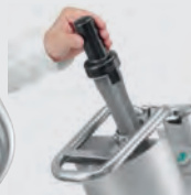
Malý otvor pro vkládání menších kousků zeleniny