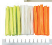
sloupky 8 mm