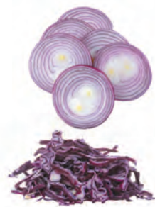
tloušťka 1-5 mm