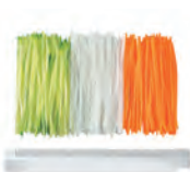
sloupky 1 mm