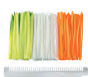
sloupky 2 mm