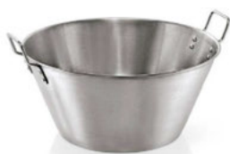
Mísa s úchyty