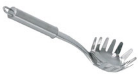
Lžice na špagety