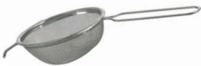
Cedníkové síto jemné