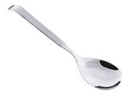
Lžice servírovací nerez