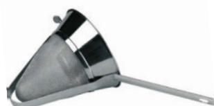
Síto bujón konické