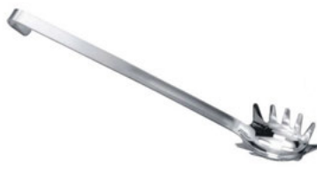
Lžice na špagety