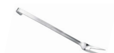
Vidlice na maso