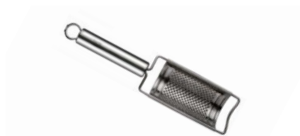
Struhadlo na citrusy