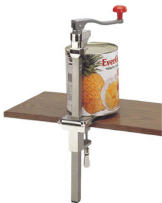
Otvírák na konzervu stolní