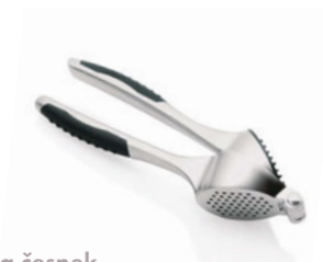
Lis na česnek