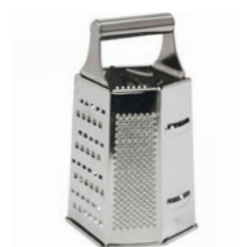
Struhadlo 6 hran