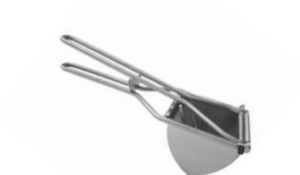
Lis na brambory