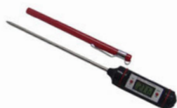
Teploměr vpichový digitální