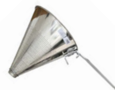
Cedník špičák pocínovaný