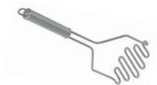
Šťouchadlo na brambory