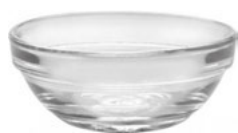
Mísy a misky skleněné stohovatelné