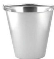
Vědro bez prstence