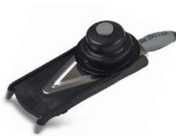
Mandolína Kobra V-Axis