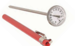
Teploměr vpichový analogový