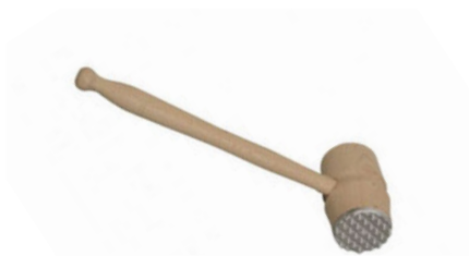
Palička na maso