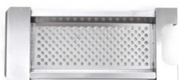
Síto na játrovou rýži

Nepostradatelný pomocník do každého provozu pro přípravu halušek či játrové rýže. Vysoká kvalita zpracování, vhodné do všech provozů. Je možné vyrobit síto na požadovaný průměr hrnce nebo kotle, dle vašich preferencí.