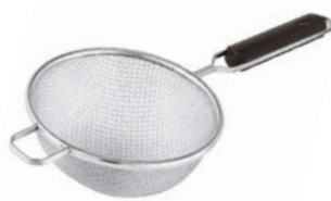
Cedníkové síto hrubé

jemné síťování, široký okraj, velikost otvorů 0,5 mm