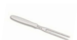
Vidlice na maso