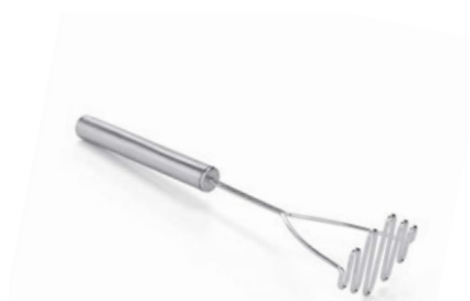
Šťouchadlo na brambory