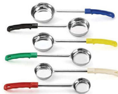
Naběračka plochá roztírací