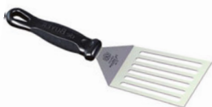
Špachtle perforovaná FKOfficeum