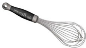
Metlička de Buyer