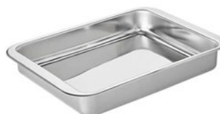
Mísa na maso