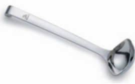
Naběračka na omastek