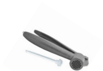
Lis na česnek