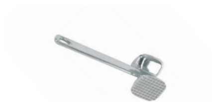
Palička na maso