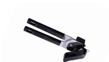
Otvírák na konzervu ruční