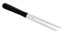
Vidlice na maso