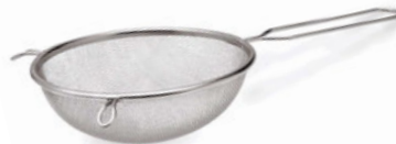
Pasírovací síto hrubé