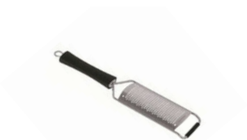
Struhadlo/perforace 2 mm