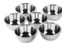
Misky nerezové/set 6 ks