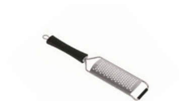
Struhadlo/perforace 4 mm