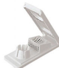
Kráječ vajec měšičky