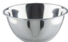
Mísa vysoká leštěná