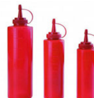
Dávkovač na omáčky červený