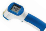
Teploměr bezkontaktní laserový