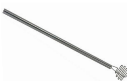
Šťouchadlo na brambory