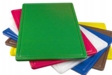
Desky barevné s drážkou