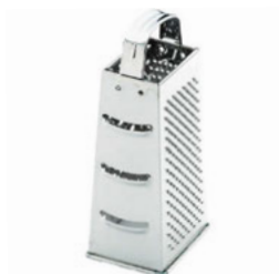
Struhadlo 4 strany