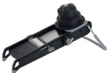
Mandolína Swing Plus

Mandoliny deBuyer jsou profesionální nástroje sloužící k rychlému, snadnému a bezpečnému krájení zejména zeleniny, ale i uzenin a ovoce. Bezpečnost použití zajišťují kloboučky, nedochází k přímému kontaktu těla s noži. Rychlost a přesnost zajišťují precizní nože. V naší nabídce máme nerezové i plastové mandoliny. Dělí se podle vybavení, velikosti a materiálu. Nejjednodušší a zároveň nejoblíbenější model je mandolína Kobra.