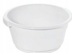
Mísa plastová se zapuštěným úchytem