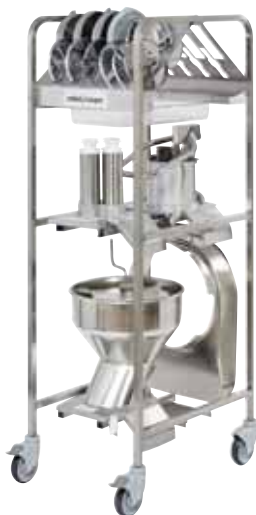
Stojan na uložení příslušenství na 16 disků, 8 nástavců a 3 násypné otvory, dodáváno s nádobou GN1/1 (příslušenství není součástí dodávky) Ref. 49132 - 40 851 Kč