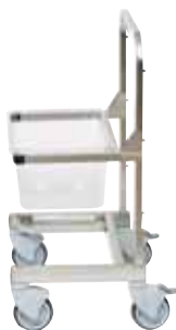
Vozík nastavitelný na 3 různé výšky GN 1/1 Dodáváno bez nádoby Ref. 49128 - 24 894 Kč