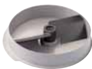
Zařízení na přípravu kaše Ref. 28208 Ø 3 mm - 6 845 Kč Ref. 28210 Ø 6 mm - 6 845 Kč