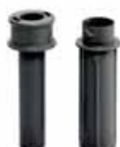
Přítlačný kolík Exactitube CL 52 - CL 55 - CL 60 Ref. 49221 - 980 Kč