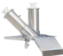
Násypný otvor s rovným a šikmým tubusem Ref. 28155 - 45 345 Kč