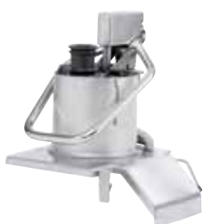
Násypný otvor s pákou s integrovaným tubusem (plocha 227 cm 2 ) Ref. 39673 - 34 573 Kč