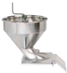
Automatický násypný otvor Ref. 28170 - 51 959 Kč