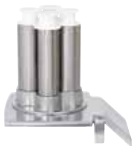
Násypný otvor 4 tubusy 2 tubusy Ø 50 mm 2 tubusy Ø 70 mm Ref. 28161 - 39 678 Kč