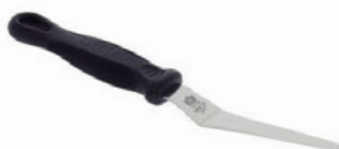
Paleta lomená FKOficium