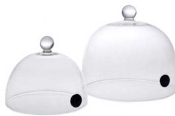
Gloš pro Aromatizer