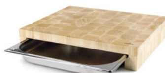
Deska krájecí GN 2/3