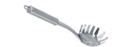
Naběračka na špagety

VC-41307SM 105 400 215 Kč nerez 18/10, monoblok