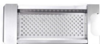
Síto na játrovou rýži

Nepostradatelný pomocník do každého provozu pro přípravu halušek či játrové rýže. Vysoká kvalita zpracování, vhodné do všech provozů. Je možné vyrobit síto na požadovaný průměr hrnce nebo kotle, dle vašich preferencí.