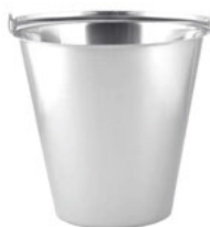
Vědro bez prstence