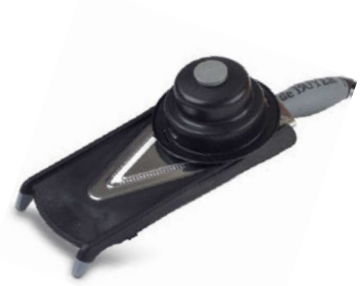
Mandolína Kobra V-Axis

kód rozměr mm cena/ks D-2011-01 š122 × p365 1 812 Kč