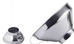
Trychtýř nerez velký

plastové provedení, se sítkem, různé barevné provedení dle nabídky