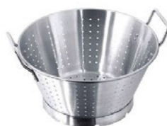
Odkapávač s prstencem