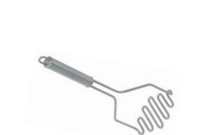
Šťouchadlo na brambory