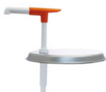
Pumpička s krytem na kbelík