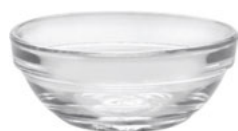
Mísy skleněné stohovatelné