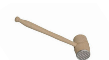
Palička na maso