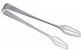
Kleště na pečivo