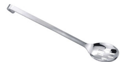
Lžíce servírovací perforovaná

VC-41304PB 400 489 Kč nerez 18/10, monoblok