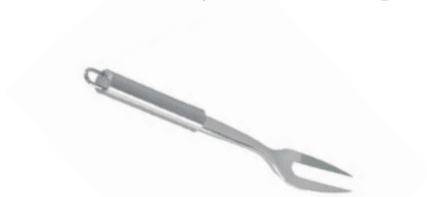
Vidlice na maso