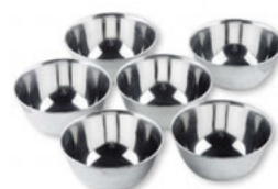
Misky nerezové/set 6 ks