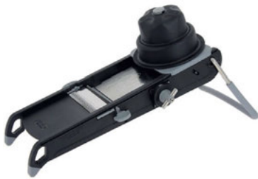
Mandolína Swing Plus

Mandoliny deBuyer jsou profesionální nástroje sloužící k rychlému, snadnému a bezpečnému krájení zejména zeleniny, ale i uzenin a ovoce. Bezpečnost použití zajišťují kloboučky, nedochází k přímému kontaktu těla s noži. Rychlost a přesnost zajišťují precizní nože. V naší nabídce máme nerezové i plastové mandoliny. Dělí se podle vybavení, velikosti a materiálu. Nejjednodušší a zároveň nejoblíbenější model je mandolína Kobra.