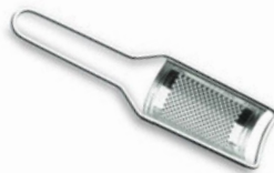
Struhadlo na citrusy