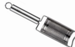
Struhadlo na citrusy