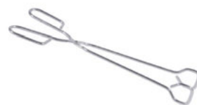
Kleště na grilování