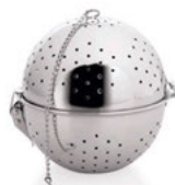
Plovák na koření s řetízkem 18/10