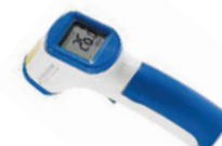
Teploměr bezkontaktní laserový

měření do 200 °C, závěsný klip s dřevěnou kuličkou pro snazší manipulaci