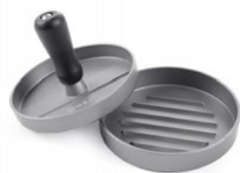
Forma na hamburgery

balení obsahuje 6 ks, nerezové provedení