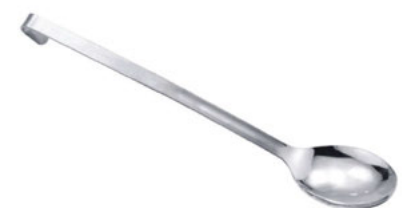
Lžíce servírovací plná

E-62609 310 0,03 392 Kč nerez 18/10, monoblok