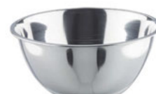
Mísa nerezová vysoká