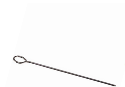
Jehla na špíz