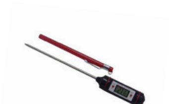
Teploměr vpichový digitální

rozsah měření -50 °C do 330 °C, škála 0,1 °C, baterie 9 V