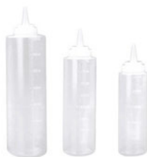
Dávkovač na omáčky transparentní