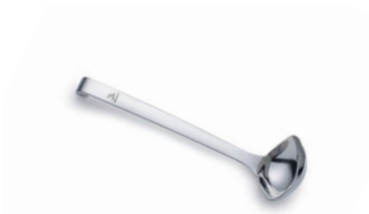
Naběračka na omastek

VC-5550-003 280 248 Kč nerezové provedení