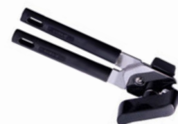
Otvírák na konzervu ruční

niklová povrchová úprava, pro pracovní desky do tloušťky 5,5 cm, pro konzervy do výšky 35 cm