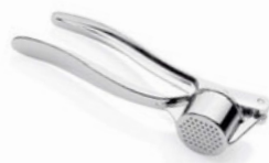
Lis na česnek