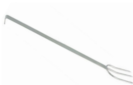
Vidlice na maso