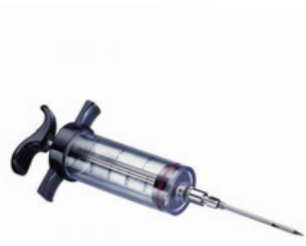
Plnička na maso s jehlou