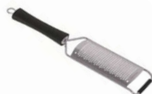
Struhadlo/perforace 2 mm