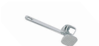
Palička na maso