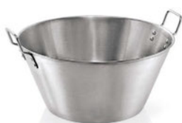
Mísa s úchyty