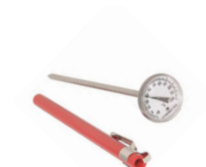
Teploměr vpichový analogový