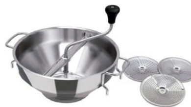
Pasírka Jumbo na hrnec