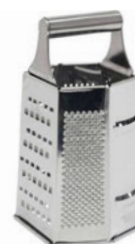
Struhadlo 6 hran