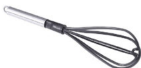
Metlička na nepřilnavý povrch