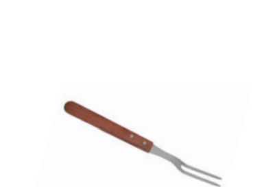
Vidlice na maso