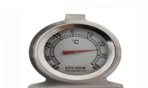
Teploměr do lednice a mrazáku

rozsah měření 0 °C do 250 °C, nerez 18/10