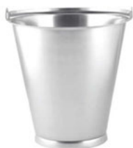
Vědro s prstencem