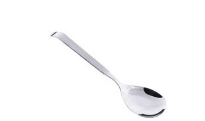
Lžíce servírovací nerez