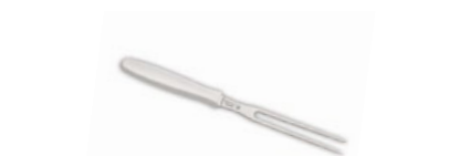
Vidlice na maso