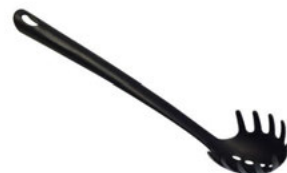
Lžíce na špagety