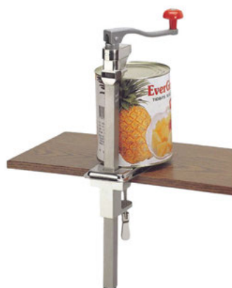
Otvírák na konzervu stolní