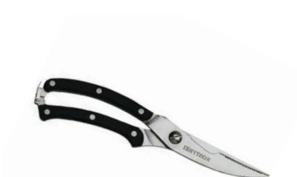
Nůžky na drůběž