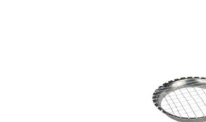
Kolečko na brambory