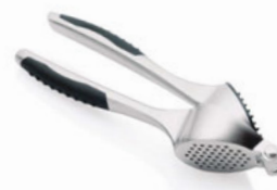
Lis na česnek