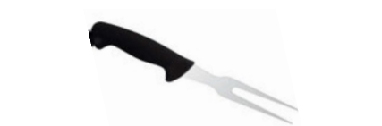
Vidlice na maso