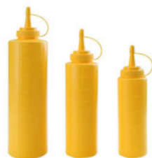
Dávkovač na omáčky žlutý