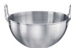
Mísa mixovací nízká