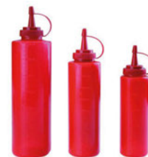
Dávkovač na omáčky červený