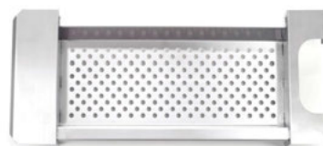
Síto na halušky

nerezové provedení, průměr perforace 7 mm, na objednávku možný i jiný rozměr