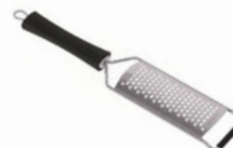
Struhadlo/perforace 4 mm