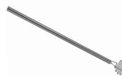
Šťouchadlo na brambory