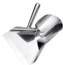
Lopátka na vkládání hranolků