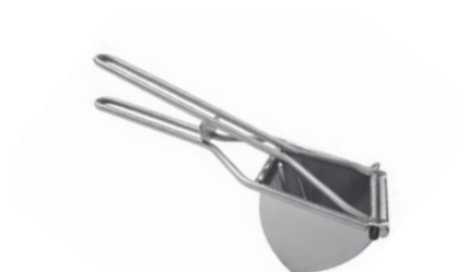
Lis na brambory