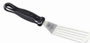
Špachtle perforovaná FKOficium