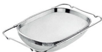
Síto na džez