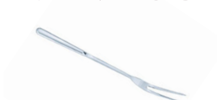
Vidlice na maso