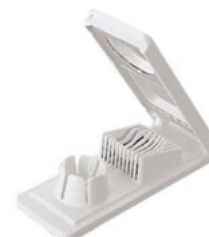
Kráječ vajec měsíčky