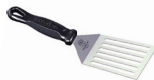
Špachtle perforovaná FKOficium