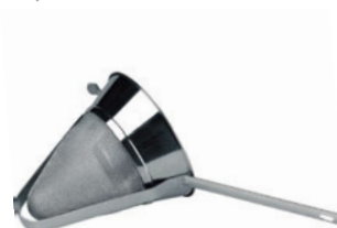
Síto bujón konické