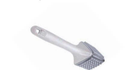
Palička na maso