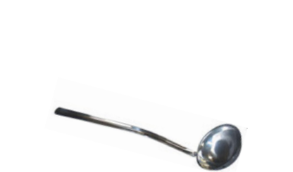
Naběračka k polévkové misce

C-35-110 380 25 272 Kč nerez 18/10, monoblok