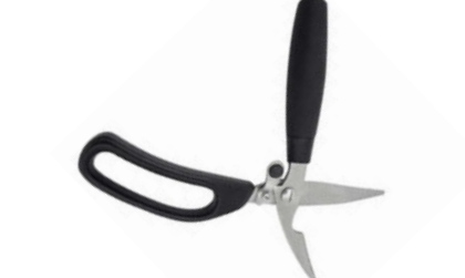
Nůžky na drůběž