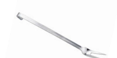
Vidlice na maso