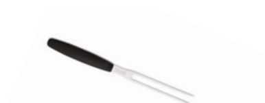
Vidlice na maso