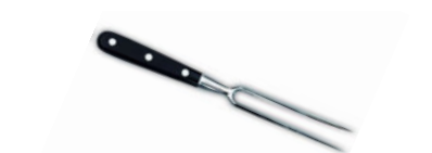
Vidlice na maso