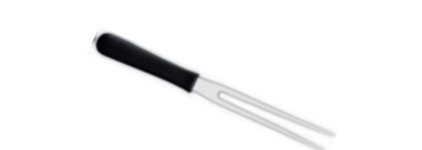
Vidlice na maso