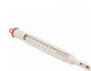
Teploměr na mléko