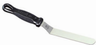
Paleta lomená FKOficium