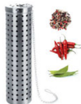
Plovák na koření s řetízkem 18/10