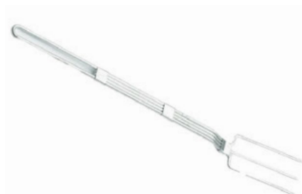
Vidlice na maso