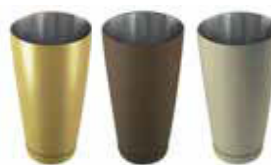
Shaker Boston STYLE 18/10