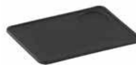
Gumová podložka pro Tamper