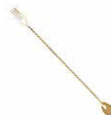
Lžička barmanská s vidličkou 18/10