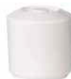
Zásobník na led