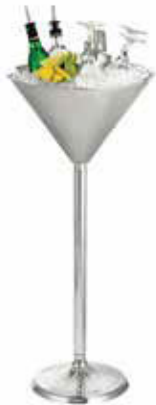
Vědro a stojan 18/10