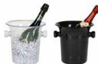
Chladič na víno