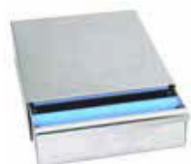
Zásuvka na použitou kávu 18/10