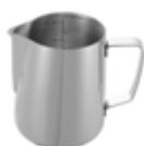
Nerezová konvička 18/10