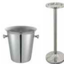
Vědro a stojan 18/10