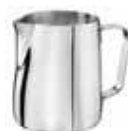
Nerezová konvička 18/10