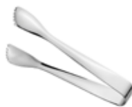
Kleště na led 18/10