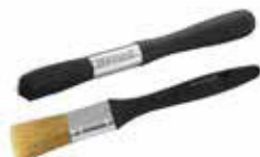
Štětec na čištění páky