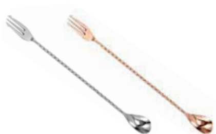
Lžička barmanská s vidličkou 18/10