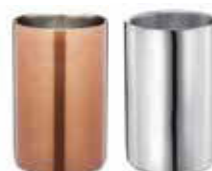
Chladič na víno 18/10, PVD