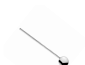
Lžička barmanská se slámkou 18/10