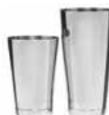
Shaker Boston TIN TIN 18/10