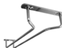
Držák na sklenice 18/10