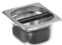
Vyklepávací nádoba GN 1/6