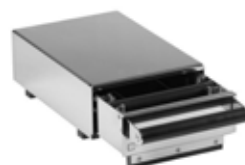
Zásuvka na použitou kávu 18/10