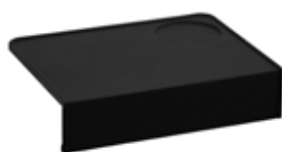
Gumová podložka pro Tamper