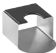
Stojánek na tamper 18/10