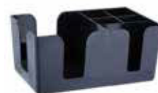
Bar Caddy dřevěný