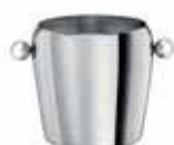
Vědro na led 18/10