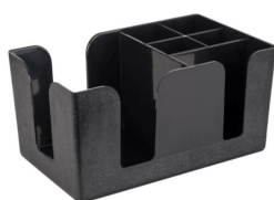
Bar Caddy leský černý