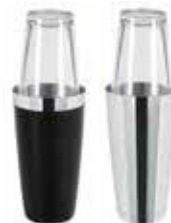
Shaker Boston se sklem 18/10