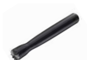
Drťítka ABS hrubé