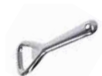
Otvírák korunkový 18/10