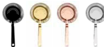
Sítka barmanské 18/10