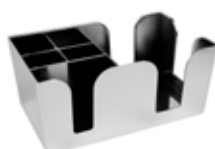
Bar Caddy chromovaný