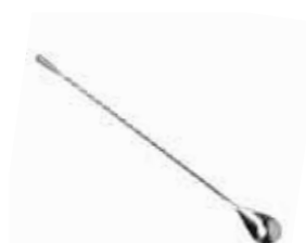
Lžička barmanská 18/10