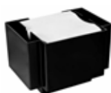
Bar Caddy plastový