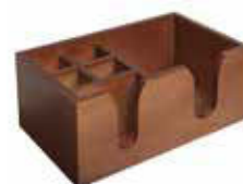
Bar Caddy dřevěný