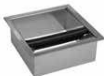
Zásuvka na použitou kávu 18/10