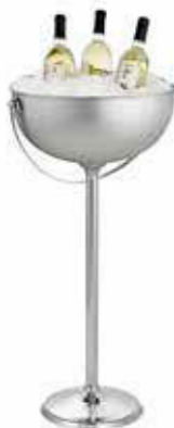
Vědro a stojan 18/10