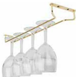
Držák na sklenice