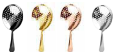
Sítka barmanské JULEP 18/10