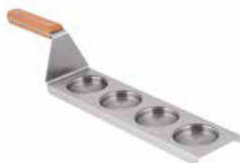
Tác servírovací na sklenice Mason Jar