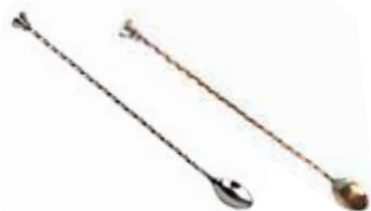
Lžička barmanská s drtítkem 18/10