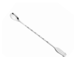
Lžička barmanská s vidličkou 18/10