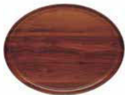
Podnos Capri/laminát, ořech

Barva černá. Protiskluzový kaučukový povrch. Vhodný do myček, max. 100 °C.