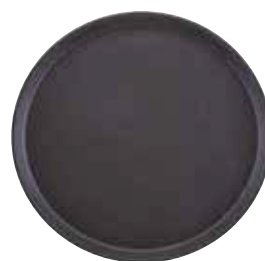
Podnos Camtread/skelné vlákno

Barva hnědá. Protiskluzový kaučukový povrch. Vhodný do myček, max. 100 °C.