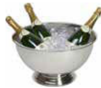
Mísa na šampaňské 18/10