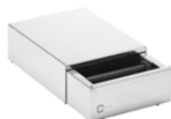
Zásuvka na použitou kávu 18/10