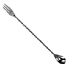
Lžička barmanská s vidličkou 18/10