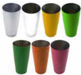
Shaker Boston STYLE 18/10