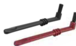
Štětky na kávovar