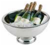
Mísa na šampaňské 18/10