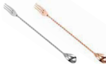
Lžička barmanská s vidličkou 18/10