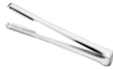
Kleště na led 18/10