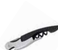
Otvírák barmanský 18/10