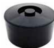
Zásobník na led