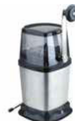
Mlýnek na led