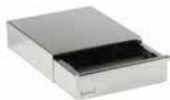
Zásuvka na použitou kávu 18/10