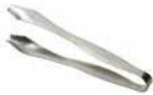
Kleště na led 18/10