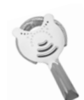
Sítka barmanské 18/10