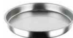
Plato servírovací 18/10

Protiskluzový povrch. Nízký okraj. Doporučeno pro ruční mytí, před stohováním je nutné tácy řádně vysušit.