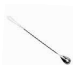
Lžička barmanská 18/10