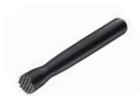
Drťítka ABS jemné