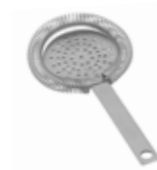
Sítka barmanské 18/10