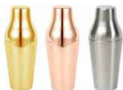
Shaker Premium 18/10