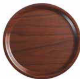
Podnos Mykonos/laminát, vlašský ořech

Hladká povrchová úprava. Vhodný do myček, max. 100 °C.