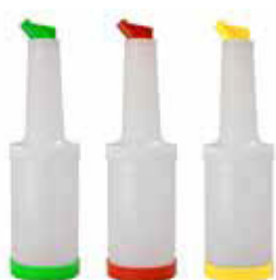
Láhev Store'n pourer