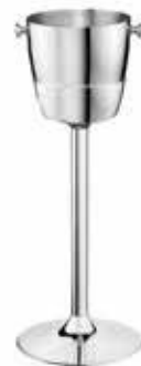
Vědro a stojan 18/10