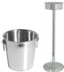
Vědro a stojan 18/10