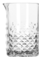
Sklenice barmanská Carats