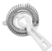
Sítka barmanské 18/10