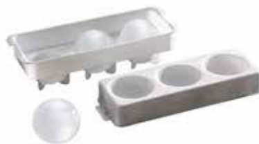
Forma na ledové koule