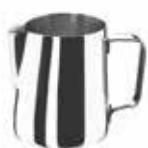
Nerezová konvička 18/10