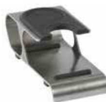
Stojánek na tamper 18/10