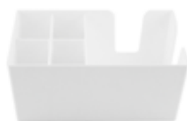
Bar Caddy plastový