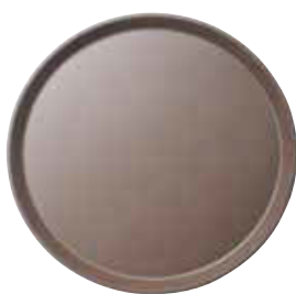
Podnos Camtread/skelné vlákno