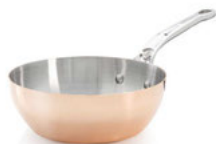
Pánev kónická Prima Matera