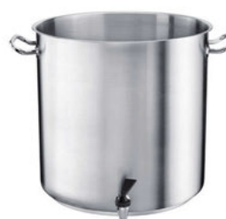
Hrncet s výpustí