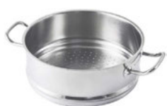
Vložka napařovací nerezová