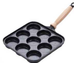
Pánev na lívance