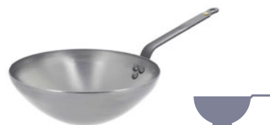
Pánev Wok Carbone Plus