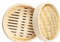
Napařovač bambusový s poklicí