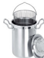
Hrncet s vložkou na chřest