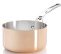
Rendlík na omáčku Prima Matera

Řada měděného nádobí vhodná na všechny typy sporáků, především na indukci. Měď tvoří 90 % materiálu nádobí a má excelentní tepelnou vodivost. Kolekce se vyznačuje perfektním zpracováním, nádobí má ergonomické nýtované rukojeti z nerezové oceli. Stěny mají nadstandardní tloušťku 2 mm. Nádobí tvoří vnitřní nerezová vrstva, která se velmi snadno udržuje – nepřenáší do pokrmu žádné pachy, zároveň je zcela odolná proti všem potravinovým kyselinám.