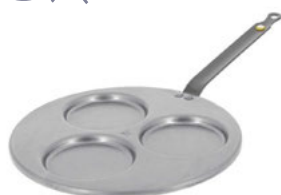
Lívanečník Mineral B