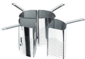
Vložka na těstoviny nerezová