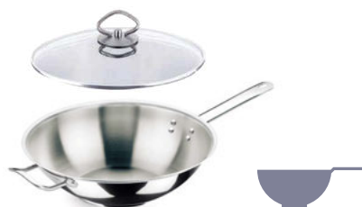
Pánev Wok nerezová