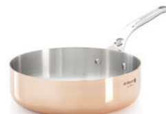
Rendlík nízký Prima Matera