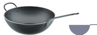
Pánev Wok modrá ocel