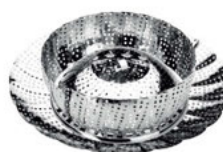
Vložka napařovací nerezová