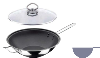
Pánev Wok nerezová nepřilnavý povrch