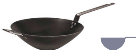
Pánev Wok modrá ocel