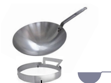
Pánev Wok Carbone Plus