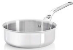
Rendlík Affinity nízký