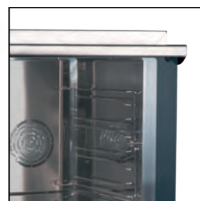
Ventilační systém zajišťuje rovnoměrnou distribuci tepla