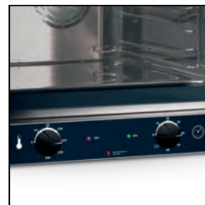
Termostat 280 °C