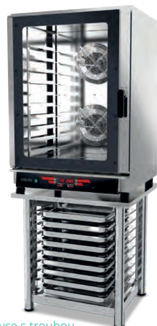
NEFOM ukázka podstavce s troubou