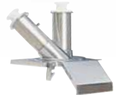
Násypný otvor 2 tubusy CL 55 Tubusy rovný a šikmý