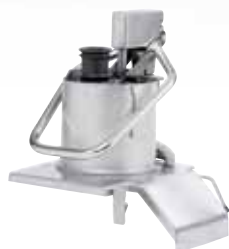
Násypný otvor s přítlačnou pákou CL 55 (Plocha 227 cm 2 ) s integrovaným tubusem