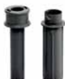
Přítlačný kolík Exactitube CL 52 - CL 55 - CL 60 Ref. 49221 - 960 Kč