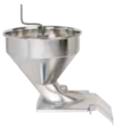
Automatický násypný otvor Ref. 28170 - 50 940 Kč