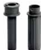
Přítlačný kolík Exactitube Ref. 49221 - 960 Kč