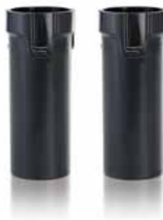
Sada pro petržel a bylinky 2 vložky