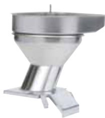
Automatický násypný otvor s podavačem Ref. 39681 - 65 810 Kč