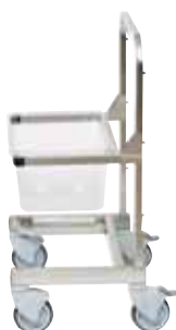
Vozík nastavitelný na 3 různé výšky GN 1/1 Dodáváno bez nádoby Ref. 49128 - 24 405 Kč