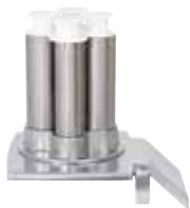
Násypný otvor 4 tubusy 2 tubusy Ø 50 mm 2 tubusy Ø 70 mm Ref. 28162 - 41 405 Kč