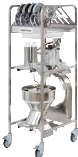
Stojan na uložení příslušenství na 16 disků, 8 nástavců a 3 násypné otvory, dodáváno s nádobou GN1/1 (příslušenství není součástí dodávky) Ref. 49132 - 40 050 Kč