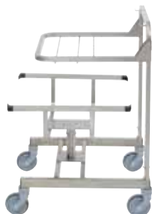
Pojízdný ergonomický vozík Dodáván bez nádob. Na 3 nádoby GN 1/1. Ref. 49066 - 32 535 Kč