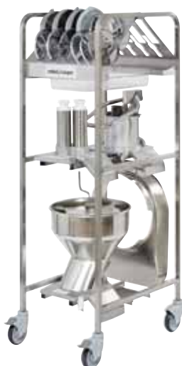
Stojan na uložení příslušenství na 16 disků, 8 nástavců a 3 násypné otvory, dodáváno s nádobou GN1/1 (příslušenství není součástí dodávky) Ref. 49132 - 40 050 Kč