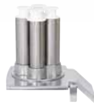
Násypný otvor 4 tubusy CL 55 2 tubusy Ø 50 mm / 2 tubusy Ø 70 mm