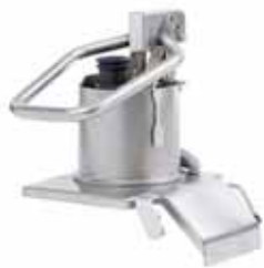
Násypný otvor s pákou Ref. 39680 - 45 530 Kč