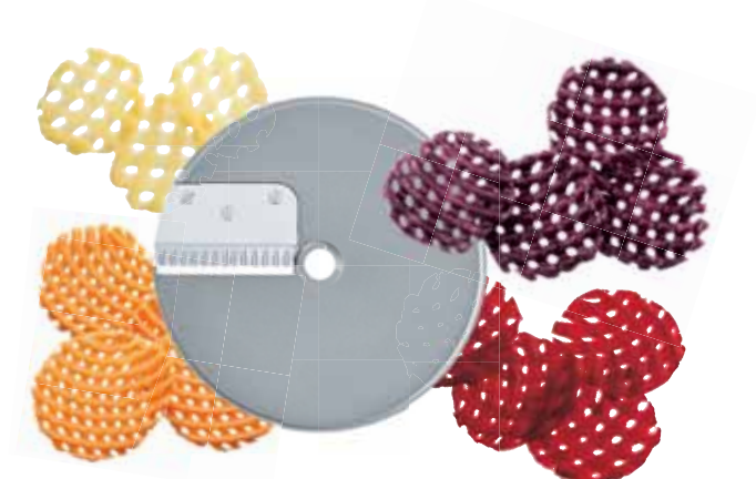
4 různé mřížky valří 2 mm - 3 mm - 4 mm - 6 mm