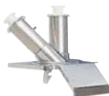
Násypný otvor s rovným a šikmým tubusem Ref. 28155 - 44 455 Kč