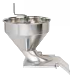
Automatický násypný otvor CL 55