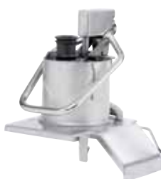
Násypný otvor s pákou s integrovaným tubusem (plocha 227 cm 2 ) Ref. 39673 - 33 895 Kč