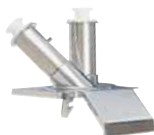
Násypný otvor s rovným a šikmým tubusem Ref. 28157 - 45 160 Kč