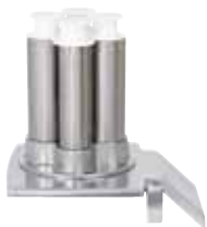
Násypný otvor 4 tubusy 2 tubusy Ø 50 mm 2 tubusy Ø 70 mm Ref. 28161 - 38 900 Kč