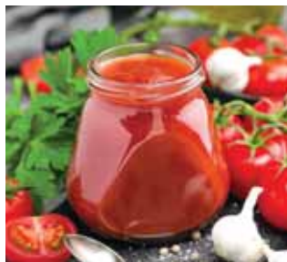
RAJČATA, PAPRIKY, JABLKOVÉ PYRÉ...