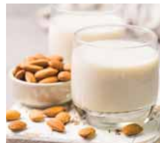
ROSTLINNÉ NÁPOJE (KOKOSOVÉ MLÉKO, MANDLE...)

Pro více aplikací kontaktujte svého regionálního prodejce.