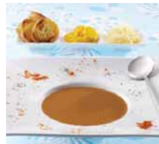
RYBÍ POLÉVKY, KORÝŠI