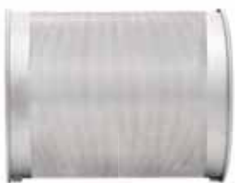
0,5 mm Určeno k filtraci nejjemnějších vláken a nečistot. Použití se sítím 1 mm.