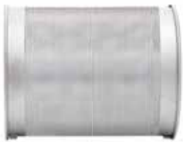
1 mm (Standardní verze)