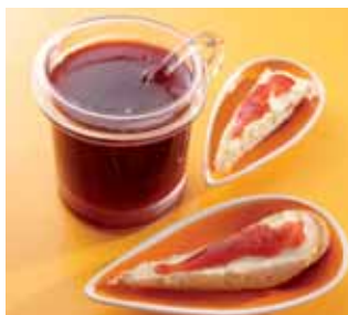
ČERVENÉ OVOCE, KAŠTANY...