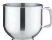
MÍŠA 7 L nerezová ocel AISI 304