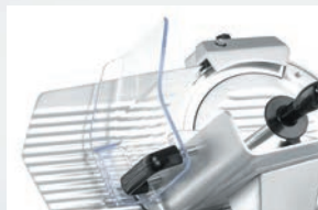
Ochranný akrylový kryt

Snadná hygiena – jednoduchá demontáž všech součástí