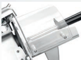
Ochranný akrylový kryt