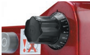
Tloušťka řezu je snadno nastavitelná