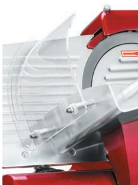
Ochranný akrylový kryt