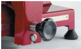
Uzavřený bezpečnostní vypínač