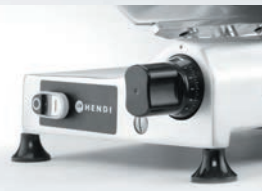
Tloušťka plátku nastavitelná v rozmezí od 0 mm do 16 mm pomocí voliče