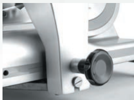
S uzamykacím mechanismem