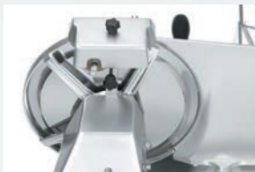
Ochrana ostří v podobě trvale namontovaného kroužku