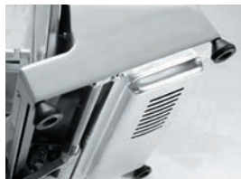
Vzduchem chlazený motor chráněný kovovým krytem