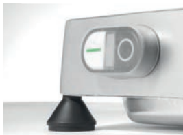
Uzavřený bezpečnostní vypínač