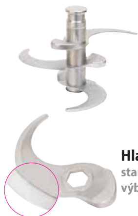
Hladký nůž standardní výbava