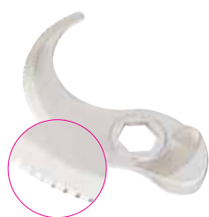
Hrubě zoubkovaný nůž