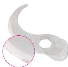
Jemně zoubkovaný nůž